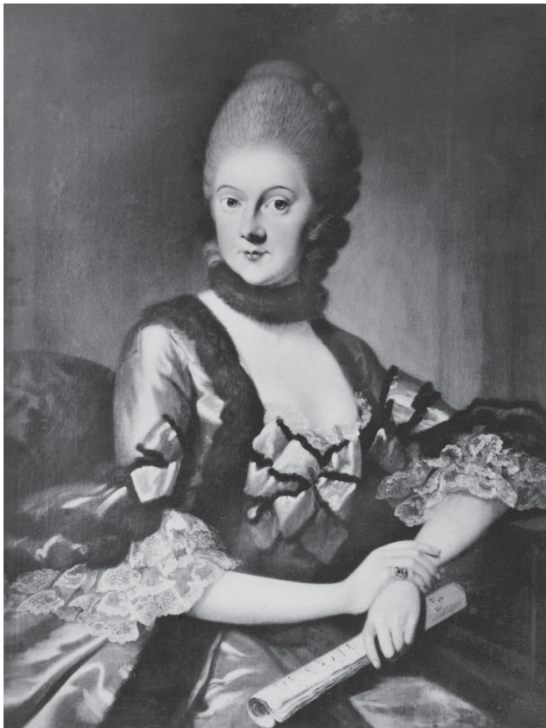
Herzogin Anna-Amalia von Sachsen-Weimar Gemälde von Johann Ernst Heinsius (1780)

oder das Rokokoschlösschen Dornburg steckte. Da bei seinem Tod 1748 sein Sohn Ernst August II. Constantin erst elf Jahre alt war, folgte eine Vormundschaftsregierung, 1755 erklärte Kaiser Franz I. den Erbprinzen für volljährig; die Politik gestaltete sein bisheriger Erzieher Graf Heinrich von Büнау. Er sorgte für die baldige Heirat des kränklichen Herzogs am 16. März 1756 mit der 16-jährigen Anna Amalia, einer Tochter Herzog Karls I. von Braunschweig-Wolfenbüttel und seiner Frau Philippine Charlotte, einer Schwester König Friedrichs II. Das junge Paar teilte die Vorliebe für Musik und förderte das Hoftheater. Die Herzogin übertraf alle Erwartungen; sie gebar am 3. September 1757 den Erbprinzen Carl August und ein Jahr später Constantin, bei dessen Geburt sie allerdings bereits Witwe war. 6