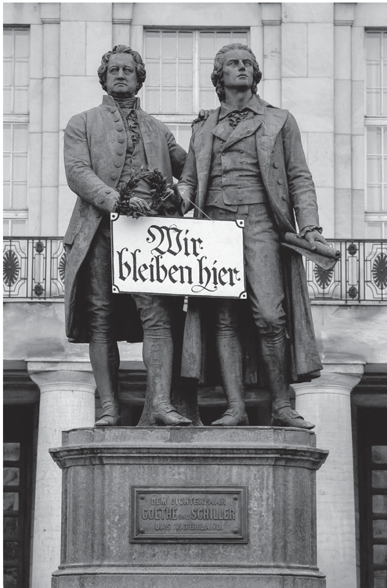
Goethe-Schiller- Denkmal in Weimar mit dem Schild «Wir bleiben hier» (November 1989)

Goethe stand den Forderungen des Volkes skeptisch gegenüber: «Das Wort Freiheit klingt so schön, daß man es nicht entbehren könnte, auch wenn es einen Irrtum bezeichnete». 4 Freiheit war für ihn «die leise Parole heimlich Verschworner, das laute Feldgeschrei der öffentlich Umwälzenden, ja das Losungswort der Despotie selbst, wenn sie ihre unterjochte Masse gegen den Feind anführt und ihr vom auswärtigen Druck Erlösung für alle Zeiten verspricht». 5 Goethe hätte 1989 wohl gefragt, ob denn das Volk wirklich wisse, was es wolle, und er hätte «mehr Licht», mehr Aufklärung gefordert. Die Überlieferung seiner engen Vertrauten berichtet von seiner letzten Bitte, «macht doch den zweiten Fensterladen in der Stube auch auf, damit mehr Licht